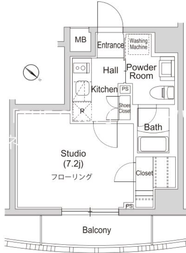
※間取・設備は現況優先